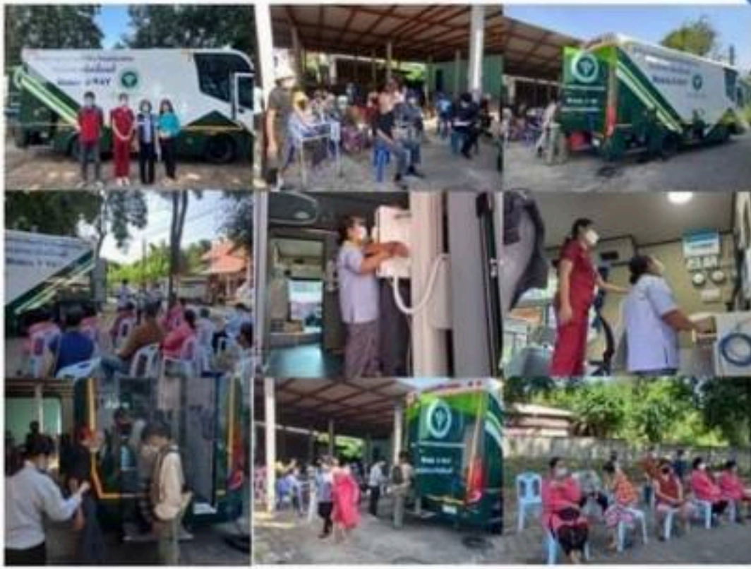
โรงพยาบาลแม่สะเรียง ออกหน่วยให้บริการเอกซเรย์คัดกรองวัณโรคปอดใน กลุ่มเสี่ยง ประจำปีงบประมาณ 2566 ณ รพสต.ห้วยสิงห์ และรพสต.น้ำดิบ